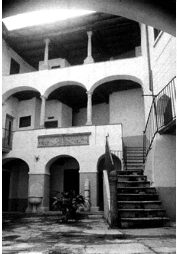
Cortile di Casa Magni

Alla base di uno degli archi al pianterreno è attaccato un frammento di una colonnina di epoca romana.