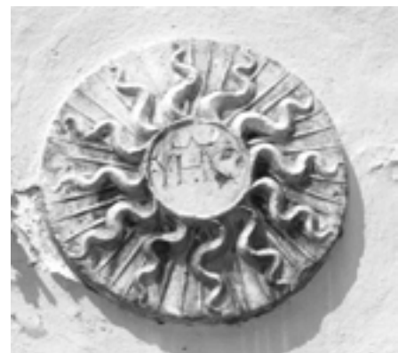
Tondo con iscrizioni