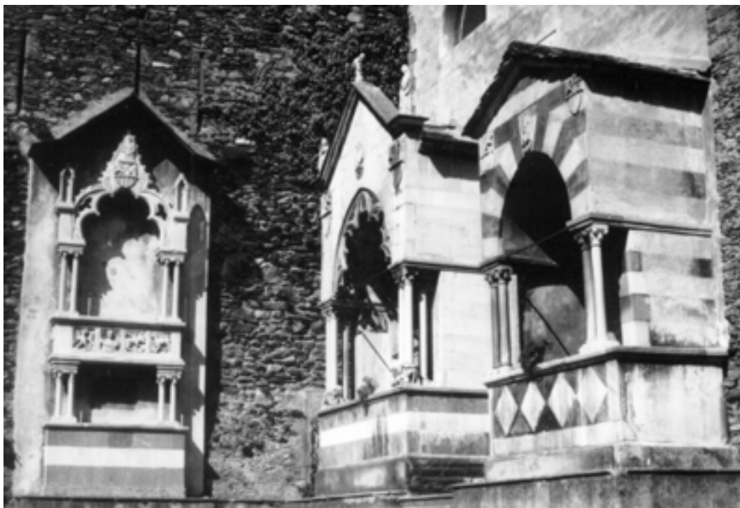
Le tre Arche Andriani

Rispetto all'immagine riprodotta in basso, è consigliabile considerarle a partire da destra verso sinistra, dato che, come avremo modo di vedere, questo sembra corrispondere al loro ordine temporale.