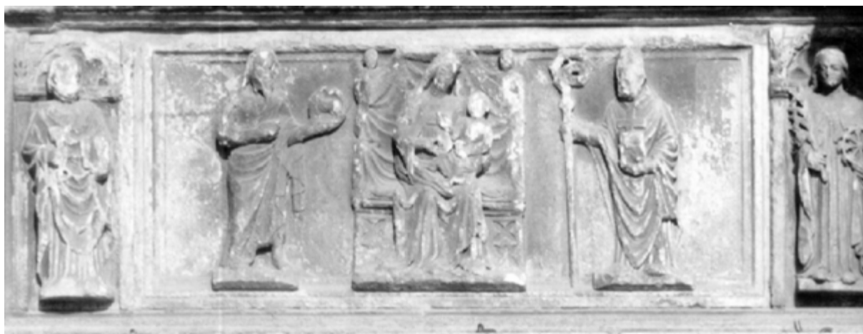
Fregio della seconda arca con a sinistra san Pietro e san Giovanni, al centro la Madonna in trono con bambino, a destra un vescovo e santa Caterina

Quest'ultima arca fino al 1870 era posta all'interno della Chiesa, come ricorda una lapide posta sulla piazzetta.