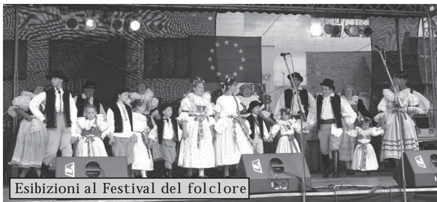
Esibizioni al Festival del folclore