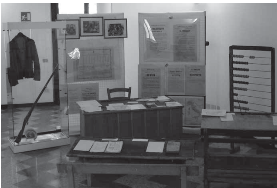
Anche gli arredi d'epoca della scuola esposti nella mostra

A GRANDE RICHIESTA LA MOSTRA RESTERÀ APERTA ANCHE SABATO 7 E DOMENICA 8 GENNAIO DALLE 10 ALLE 12 E DALLE 15 ALLE 18