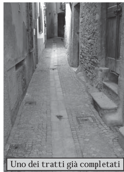
Uno dei tratti già completati

to necessario impiegare maggiori risorse (circa 40 mila euro) ed attendere, per la perizia necessaria al completamento dei lavori, il necessario parere della Regione che ha finanziato buona parte dei costi di costruzione dell'opera. E' invece in dirittura d'arrivo l'intervento di riqualificazione di alcune vie del centro storico (via e piazzetta Schenardi e via Madonnina), che dopo il rifacimento dei sottoservizi vengono completate in questi giorni con la porfidatura. La via Volta, non inserita originariamente in questo lotto di lavori, verrà comunque sistemata a conclusione degli stessi.