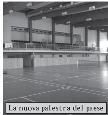
La nuova palestra del paese

La prima domenica di Avvento i cittadini di Rousínov si sono ritrovati in piazza per cominciare tutti insieme il tempo dell'Avvento. I bambini