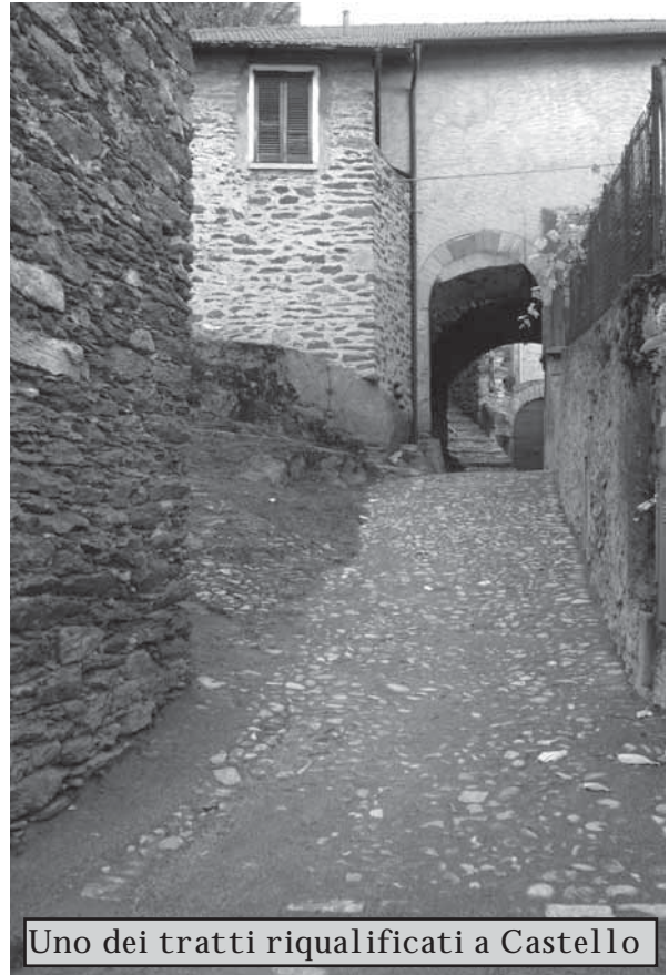
Uno dei tratti riqualificati a Castello

inoltre ripresi gli interventi per concludere l'ultima parte del recupero del sentiero che da Corenno porta a Vestreno attraverso le fortificazioni militari della "Linea Cadorna", eseguito dalla Protezione Civile degli Alpini di Lecco con fondi esclusivamente a carico di enti sovracomunali.